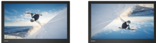
反転表示機能で設置方法に合わせた映像表示

デジタル入力時、フルHD以外の映像信号を入力した際、ピクセル等倍表示機能で実際入力されたピクセル数での映像表示が可能となります。また設置場所や用途に合わせて上下、左右での画面反転表示が可能です。