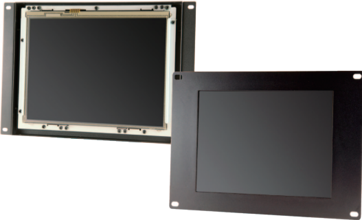
KE097S / KE097ST