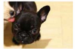
一般7型液晶モニター採用 800x480 (WVGA)での表示時