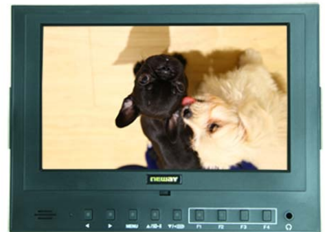
イメージフリップ機能有効時