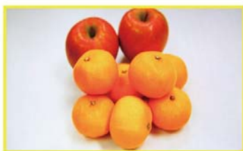
【ピーキング機能無効時】ピントが合っている状態

ピントの合ったエッジ部分だけに銀白色のラインを表示、ピントが合っている位置を明確にします。ピントの合わせにくいマニュアルフォーカスレンズやオールドレンズを使用する際に有効です。