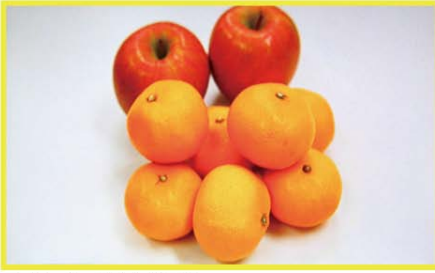
【ブルーガン機能無効時】

ブルーガン機能を使用すると、接続したカメラが撮影する発色とカメラにて表示される発色とを青色信号表示のみを行い NTSC カラーバー表示時にキャリブレーション、モニター色彩表示を正確に合わせる事が可能です。