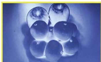
【モノクロピーキング機能有効時】ピントが合っている状態