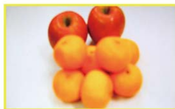
【ピーキング機能無効時】ピントが合っていない状態