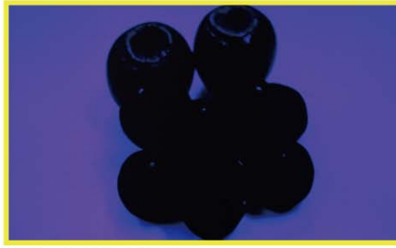
【ブルーガン機能有効時】