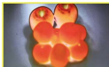
【カラーピーキング機能有効時】ピントが合っていない状態