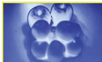
【モノクロピーキング機能有効時】ピントが合っていない状態